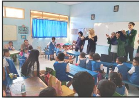
Gambar 1. Pemaparan materi di kelas

penyuluhan atau edukasi tentang CTPS dengan baik dan benar. Sebelum dan sesudah kegiatan pengabdian ini dibagikan kuisioner yang digunakan sebagai tolak ukur untuk mengetahui pemahaman siswa tentang materi yang disampaikan. Materi disajikan dalam bentuk ceramah, bernyanyi dan simulasi gerakan cuci tangan bersama baik di kelas maupun di luar kelas ( Gambar 1, 2 dan 3 ). Hasil yang diharapkan adalah dengan diadakan kegiatan ini adalah meningkatkan pengetahuan tentang cara mencuci tangan pakai sabun yang benar pada anak usia prasekolah TK Pelita Wonoasri. Pengetahuan yang diharapkan tidak hanya pada anak prasekolah tetapi juga pada orang tua serta guru yang mengajar di sekolah tersebut. Dengan bimbingan dan arahan dari orangtua serta guru, anak-anak akan semakin mudah untuk memahami serta mempraktekkan CTPS yang benar.