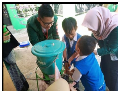
Gambar 3. Praktek cuci tangan pakai sabun di halaman sekolah

Kementerian Kesehatan (2015) menyatakan kegiatan CTPS dilaksanakan untuk tujuan menurunkan tingkat kematian pada anak terutama yang terkait dengan kurangnya akses sanitasi dan Pendidikan kesehatan. Menurut peneliti WHO mencuci tangan pakai sabun dan air bersih dapat menurunkan resiko diare hingga 50%. CTPS bila dipraktekkan secara tepat dan benar juga merupakan cara termudah dan efektif untuk mencegah berjangkitnya penyakit seperti ISPA, kolera, cacangan, flu, hepatitis A, dan sebagainya (Setiawan, 2014). Adanya kegiatan tersebut, anak-anak sangat antusias untuk belajar dan mempraktekkan CTPS sambil menyanyikan lagu cuci tangan, sehingga anak-anak lebih tertarik dan dapat memperhatikan cara CTPS dengan benar.