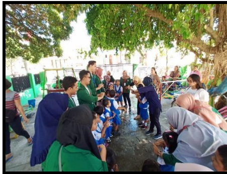
Gambar 2. Praktek gerakan cuci tangan dan bernyanyi di halaman sekolah

Kementerian Kesehatan (2015) menyatakan kegiatan CTPS dilaksanakan untuk tujuan menurunkan tingkat kematian pada anak terutama yang terkait dengan kurangnya akses sanitasi dan Pendidikan kesehatan. Menurut peneliti WHO mencuci tangan pakai sabun dan air bersih dapat menurunkan resiko diare hingga 50%. CTPS bila dipraktekkan secara tepat dan benar juga merupakan cara termudah dan efektif untuk mencegah berjangkitnya penyakit seperti ISPA, kolera, cacangan, flu, hepatitis A, dan sebagainya (Setiawan, 2014). Adanya kegiatan tersebut, anak-anak sangat antusias untuk belajar dan mempraktekkan CTPS sambil menyanyikan lagu cuci tangan, sehingga anak-anak lebih tertarik dan dapat memperhatikan cara CTPS dengan benar.