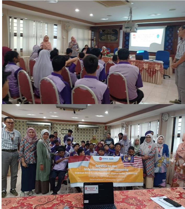
Gambar 2. Foto Pelaksanaan Pengabdian Masyarakat