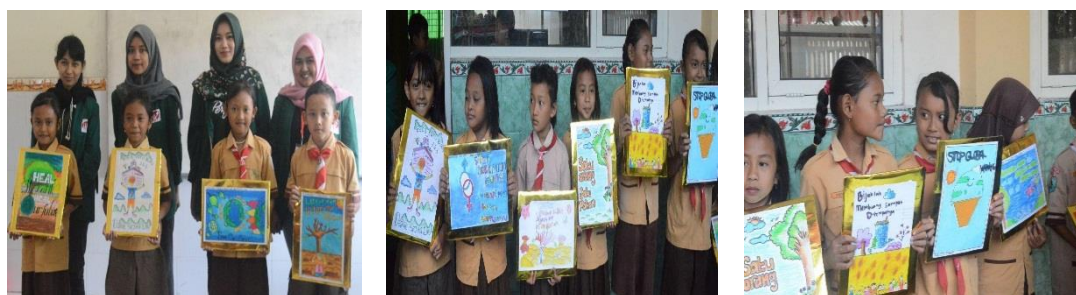
Gambar 3.4 Hasil Karya Siswa

Kegiatan ini menghasilkan produk berupa hasil karya slogan siswa yang ditunjukkan dalam mini pameran dan dipajang di kelas serta lingkungan sekolah.