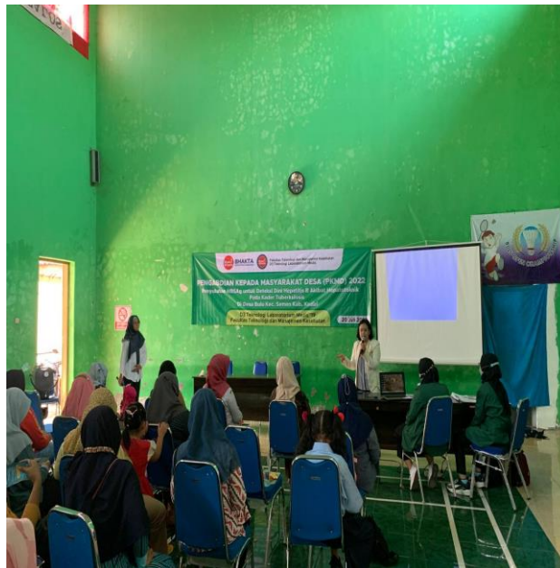
Gambar 1. Pemaparan materi kepada peserta Penyuluhan didesa bulu

Jumlah Peserta yang ikut penyuluhan adalah 25 orang dengan usia rata-rata adalah 36 tahun yang berjenis kelamin Perempuan yang mengikuti posttest berdasarkan gambar 2 dibawah. Dari hasil kuisioner yang merupakan bagian posttest didapatkan bahwa 100% peserta menjawab benar untuk definisi DAGUSIBU yang adalah singkatan dari Dapatkan, Gunakan, Simpan dan Buang. Tujuan dari pengenalan DAGUSIBU adalah agar lebih memahami tentang obat. Obat di Definisikan sebagai bahan atau panduan bahan yang digunakan dalam penetapan diagnosis, pencegahan, penyembuhan, pemulihan, peningkatan kesehatan, kontrasepsi untuk manusia.