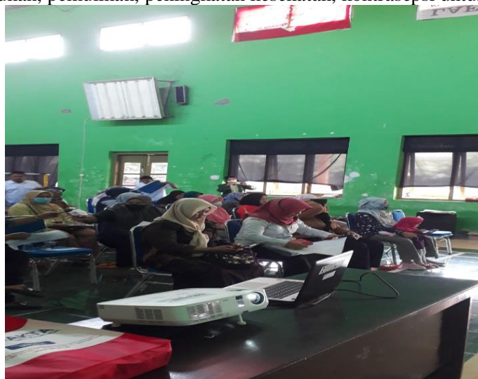
Gambar 2. Pengerjaan Postest setelah pemaparan dan diskusi dengan peserta

Jumlah Peserta yang ikut penyuluhan adalah 25 orang dengan usia rata-rata adalah 36 tahun yang berjenis kelamin Perempuan yang mengikuti posttest berdasarkan gambar 2 dibawah. Dari hasil kuisioner yang merupakan bagian posttest didapatkan bahwa 100% peserta menjawab benar untuk definisi DAGUSIBU yang adalah singkatan dari Dapatkan, Gunakan, Simpan dan Buang. Tujuan dari pengenalan DAGUSIBU adalah agar lebih memahami tentang obat. Obat di Definisikan sebagai bahan atau panduan bahan yang digunakan dalam penetapan diagnosis, pencegahan, penyembuhan, pemulihan, peningkatan kesehatan, kontrasepsi untuk manusia.