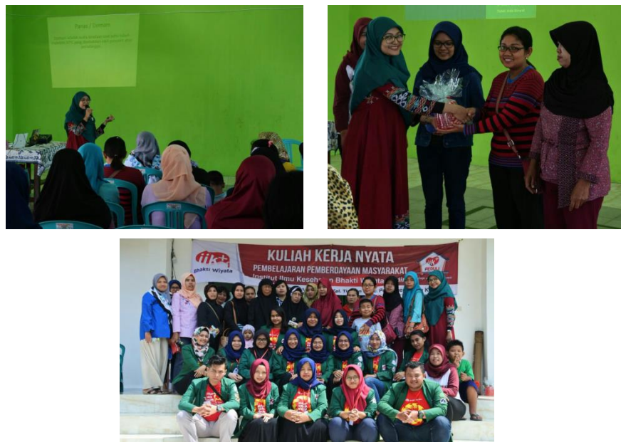
Gambar 1. Pelaksanaan kegiatan penyuluhan