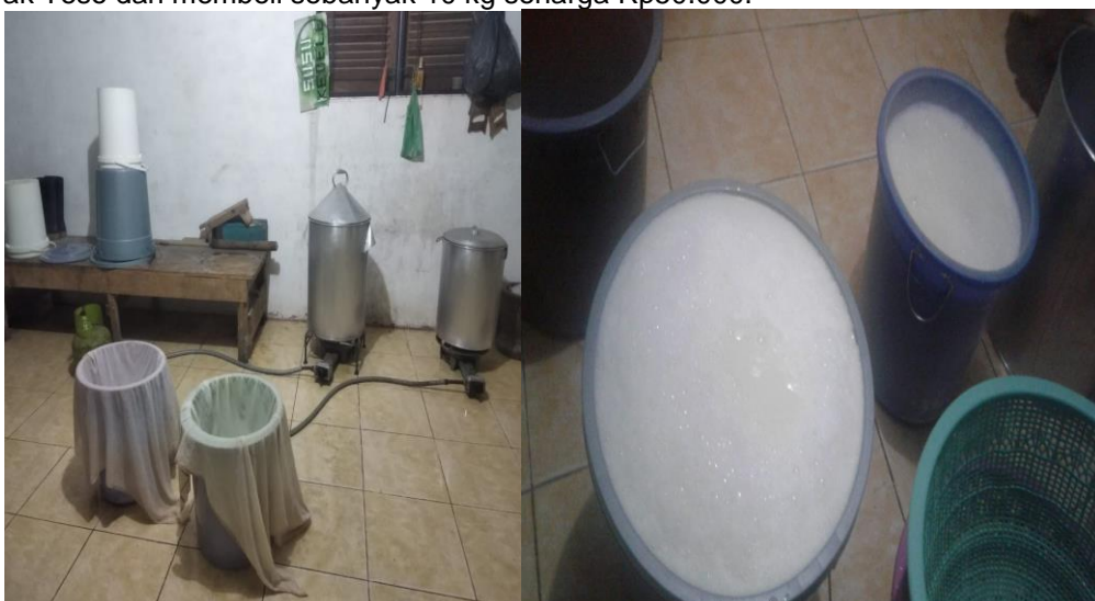
Gambar 2. Suasana Ruang Dapur untuk Produksi Susu Kedelai

Pada Gambar 1 diatas terlihat jumlah produksi dan bahan baku kedelai yang telah di stok oleh pak Teso. Dalam kegiatan untuk membuat susu kedelai Pak Teso menjelaskan bahwa bahan yang digunakan adalah kedelai, gula pasir, pemanis buatan, dan air. Setiap Hari kedelai yang diolah sebanyak 5 kg. Kedelai ini direndam selama 4 jam, di cuci sampai bersih, kemudian di giling. Selanjutnya Air direbus dalam dandang sebanyak 20 liter, tunggu sampai mendidih, kemudian kedelai yang sudah digiling dimasukkan, dia duk-aduk, sampai mendidih. Dalam proses tersebut kemudian sambal produksi adonan kedelai disiram dengan air masak. Demikian dilakukan sampai susu kedelai matang. Selanjutnya air kedelai disaring, dan ampasnya disisihkan. Ampas kedelai ini akan laku dijual seharga Rp5000/kg. Ampas ini biasa dibeli langsung oleh peternak kambing dengan datang ke rumah Pak Teso dan membeli sebanyak 10 kg seharga Rp50.000.-