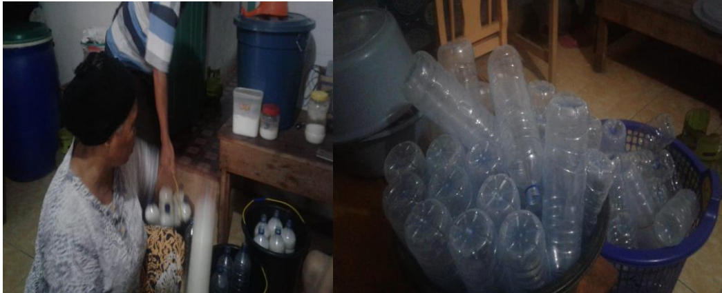
Gambar 3. Proses Pengemasan Susu Kedelai ke dalam Botol Aqua Bekas

Setelah susu kedelai matang, maka langsung dikemas dalam wadah plastik dan di ikat karet sebanyak 200 bungkus. Produksi hari ini dimasukkan kulkas untuk dijual ke esokan harinya. Demikian juga kemasan botol dimasukkan dalam kulkas untuk dijual ke esokan harinya. Esok harinya Tim Pak Teso dan Pak Teso memasarkan susu kedelai ke sekitar Sekolah dan warung yang ada di Desa Mekar Sawit. Setiap sekolah dan warung ia antarkan 10 bungkus kecuali diminta lebih. Demikianlah keseharian pak Teso dan karyawannya dalam kegiatan produksi susu kedelai.